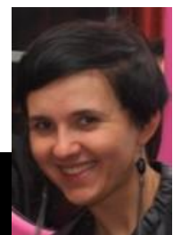
Pilnie spisała: Małgorzata Kowalczyk, Fundacja Firmy Rodzinne

Zdjęcia ze spotkania opublikowaliśmy na stronie firmyrodzinne.org – zakładka Aktualności , lub pod linkiem: www.tinyurl.com/dxdy258