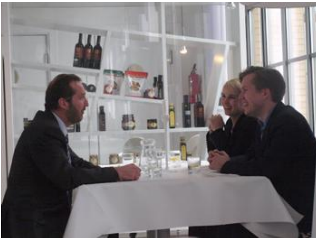
Fot. Olivier de Richoufftz w rozmowie z młodszym pokoleniem rodziny Olszewskich – Solaris Bus & Coach

Właściwym celem wystąpienia Pana Oliviera było przedstawienie przedmiotu działalności FBN. Inicjując każdego roku ponad 150 projektów, organizacja stawia sobie za cel stworzenie międzynarodowego forum kontaktu oraz wymiany doświadczeń pomiędzy firmami rodzinnymi na całym świecie. Działając pod hasłem: „By familie,... for familie, for successful enterprises” akcentują rolę firm i ich przedstawicieli, którzy sami ustalają kierunki oraz priorytety aktualnej działalności organizacji. W ramach programu Next Generation, FBN kieruje do przedstawicieli pokolenia sukcesorów program praktyk i staży partnerskich. Potencjalni następcy mogą zdobywać bezcenne doświadczenie oraz uczyć się prowadzenia biznesu w siedzibie dowolnej firmy na całym świecie.